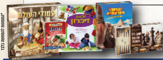
יחומות להחשיפה בלבד

עשרות משחקי 'ישראלטויס' יוקרתיים ושווים במיוחד!